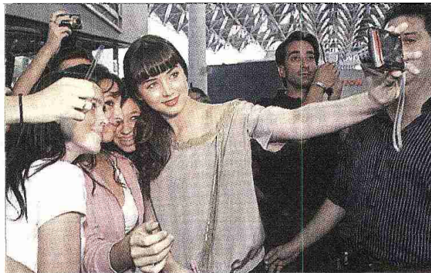
Ana de Armas estuvo de lo más atenta con sus fans en Sevilla