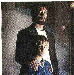
Martín y su hijo Lucas